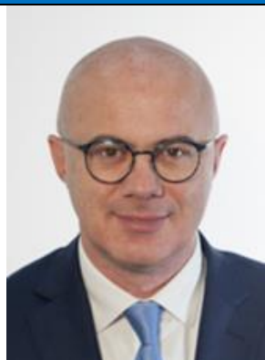
FEDERICO D'INCA' M5S Eletto in Veneto