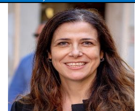
Alessandra Todde M5S

Nata a Nuoro il 6 febbraio 1969 - Laurea in Scienze dell'Informazione e in Informatica all'Università di Pisa.