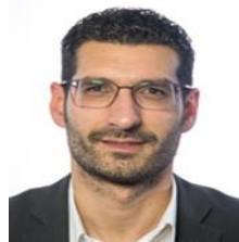
On. Giuseppe l'Abbate M5S Eletto in Puglia

Nato il 13 marzo 1985 a Castellana Grotte (Bari) – Laurea in Informatica e Tecnologie per la Produzione di Software nel 2010 all'Università degli Studi di Bari.