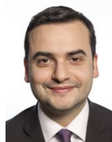
On. Carlo Sibilìa M5S Eletto in Campania

Nato ad Avellino il 7 febbraio 1986 - Laurea in biotecnologie – Impiegato. Come attivista M5S: ha fondato tra il 2007 e il 2008 il Meetup Amici di Beppe Grillo di Avellino, ha partecipato al progetto dei punti SOS AntiEquitalia di cui è stato referente e coordinatore e alla scrittura di un progetto di legge per superare il "metodo Equitalia". Eletto nella XVII Legislatura è stato componente della Commissione Affari Esteri e, poi, della Commissione Finanze , dove ha ricoperto anche il ruolo di Capogruppo, e della Commissione d'inchiesta sulle banche . È stato, altresì, Vicepresidente del M5S in Aula . Riconfermato nella XVIII Legislatura è stato nominato Segretario della Presidenza della Camera. Già Sottosegretario all'Interno nel I Governo Conte.