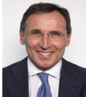
FRANCESCO BOCCIA PD Eletto in Emilia-Romagna