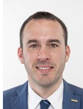
On. Malio Di Stefano M5S Eletto in Lombardia

Nato a Palermo il 16 maggio 1981 - Laurea in Ingegneria informatica - Consulente informatico. Ha lavorato per Accenture (2006- 2012). Si interessa di sviluppo delle aree svantaggiate e dal 2009 collabora con AMKA Onlus per lo sviluppo sostenibile del sud del mondo. Militante grillino sin dai tempi del V- Day, si è candidato – senza successo – a sindaco di Milano nel 2011 con il M5S. Nel 2013 viene eletto Deputato ed è membro e Capogruppo della Commissione Affari Esteri . Viene, altresì, eletto Delegato italiano presso l'Assemblea Parlamentare del Consiglio d'Europa (Commissione Migranti). Diviene, in seguito, Presidente del Sub-Committee on Refugee and Migrant Children and Young People Dal 2015 è responsabile dell'applicazione LEX della piattaforma Rousseau che servirà ai cittadini per presentare disegni di legge direttamente in Parlamento. Nel 2017 diviene responsabile M5S del programma di Governo sulla Politica Estera . Alle politiche del 2018 viene rieletto alla Camera e diventa Sottosegretario agli Affari Esteri nel I Governo Conte .