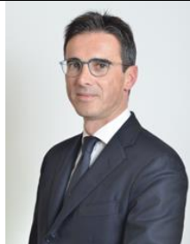
Sen. Mario Turco M5S Eletto in Puglia

Nato a Taranto il 14 giugno 1968 - Professore di Economia Aziendale presso il dipartimento di Scienze dell'Economia di Unisalento, Dottore Commercialista e Revisore dei Conti. Alle elezioni politiche del 2018 è stato eletto al Senato con il M5S, dove è stato Membro della Commissione Bilancio, della Commissione di vigilanza sulla Cassa Depositi e Prestiti e, da ultimo, della Commissione Finanze . Particolarmente attivo sui temi dell'Ilva e dello sviluppo del territorio di Taranto.