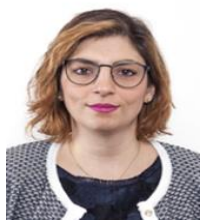
On. Laura Castelli Vice Ministro M5S Eletta in Piemonte

Nata a Torino il 14 settembre 1986 - Laurea in Economia aziendale – Contabile. Ha lavorato per qualche anno nel settore fiscale e poi per il gruppo consiliare regionale del Piemonte del Movimento 5 Stelle. Nella XVII Legislatura è stata: componente Commissione Bilancio (Capogruppo dal 7 maggio 2013 al 18 giugno 2015) e Vicepresidente (dal 25 novembre 2016) della Commissione parlamentare di inchiesta sulle condizioni di sicurezza e sullo stato di degrado delle città e delle loro periferie. Ha, seguito in particolare, le seguenti tematiche: riordino della fiscalità per i cittadini e per le imprese (creazione di un cassetto fiscale, iva per cassa, revisione degli studi di settore); introduzione di criteri di finanza etica e impatto ambientale minimi obbligatori ; creazione di posti di lavoro attraverso una pianificazione energetica e industriale nuova, ecosostenibile. Eletta in Piemonte è stata nominata Vice Presidente Vicario del Gruppo alla Camera nella XVIII Legislatura. Già Vice Ministro dell'Economia nel I Governo Conte.