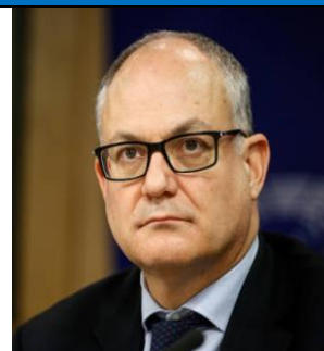
ROBERTO GUALTIERI PD Europarlamentare