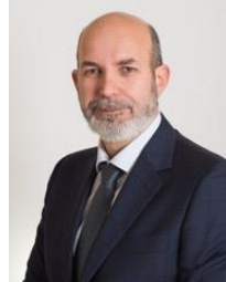
Sen. Vito Claudio Crimi Vice Ministro M5S Eletto in Lombardia

Nato il 26 Aprile del 1972 a Palermo –Diploma liceo scientifico.