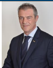
Sen. Gianluca Castaldi M5S Eletto in Abruzzo

Nato il 27 giugno a Vasto (Chieti) - Diplomato ISEF (Istituto Superiore di Educazione Fisica) – Artigiano, Commerciante, Imprenditore. Nella XVII Legislatura è stato componente della Commissione Industria, rieletto alle politiche del 2018 è stato Segretario di Presidenza del Senato e Capogruppo in Commissione Industria . Ha fatto, altresì, parte di ulteriori Commissioni parlamentari (Membro della Commissione Affari Costituzionali, Difesa, Finanza). Dal 25 settembre 2018 è Membro della Delegazione Italiana all'Assemblea parlamentare della organizzazione per la sicurezza e la cooperazione in Europa ( OSCE ).