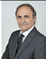
Sen. Ricardo Antonio Merlo Gruppo Misto-MAIE Eletto nella circoscrizione estera America Meridionale

Nato il 25 maggio 1962 a Buenos Aires – Laurea in Scienze Politiche all'Università del Salvador di Buenos Aires ha perfezionato i suoi studi in Italia presso l'Università di Padova - Imprenditore, docente universitario, giornalista.