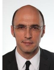
On. Matteo Mauri ViceMinistro PD Eletto in Lombardia

E' nato il 24 maggio 1970 a Milano - Laurea in Scienze politiche alla Statale di Milano con tesi sulle politiche abitative- Dirigente politico.