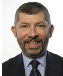
On. Ivan Scalfarotto PD Eletto in Lombardia

Nato a Pescara il 16 agosto 1965 - Laurea in Giurisprudenza - Direttore risorse umane. Impegnato a sostegno dei diritti delle diversità, è stato candidato alla leadership nazionale del centrosinistra alle elezioni primarie de L'Unione del 2005 e, dal 2009 al 2013, è stato Vicepresidente del Partito Democratico . Nel 2015 e nel 2016 compare, in entrambe le occasioni come unico italiano, nella Global Diversity List - Top 50 diversity figures in public life Global Diversity List dell'Economist che elenca le cinquanta persone che hanno maggiormente contribuito, nella loro funzione pubblica, al progresso e al riconoscimento dei diritti della diversità. Candidato alle elezioni politiche del 2013 nella lista del PD in Puglia, è stato eletto alla Camera dei deputati . Il 28 febbraio 2014 viene nominato Sottosegretario alle Riforme costituzionali e ai Rapporti con il Parlamento nel Governo Renzi e successivamente Sottosegretario allo Sviluppo economico , nel Governo Gentiloni. Il 23 settembre 2014 viene nominato Coordinatore regionale dell'ufficio politico pugliese del partito. Rieletto nel 2018 ha ricoperto il ruolo di componente della Commissione Affari Esteri.