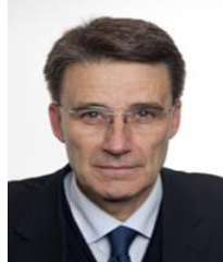
On. Roberto Morassut PD Eletto in Lazio

Nato a Roma il 16 novembre 1963 - Laurea in Lettere indirizzo Storia contemporanea presso l'Università La Sapienza di Roma – Dirigente di partito.