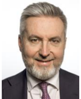
LORENZO GUERINI PD