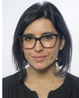
FABIANA DADONE M5S Eletta in Piemonte