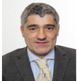
On. Roberto Traversi M5S Eletto in Liguria

Nato a Milano il 1° dicembre del 1969 – Laurea in Architettura presso l'Università di Genova - Architetto specializzato in progettazione.