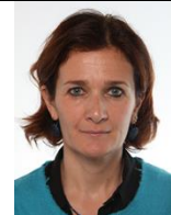
Lorenza Bonaccorsi PD

Nata a Roma, il 20 luglio 1968 - Laurea in Storia dell'Economia all'Università Statale di Milano. Ha lavorato all'ufficio comunicazione dell'Auditorium Parco della Musica di Roma, come capo della segreteria del Ministro delle Comunicazioni Paolo Gentiloni e come responsabile delle Relazioni Istituzionali e dei Rapporti con la Comunità Europea della Regione Lazio sotto la giunta Marrazzo. Iscritta alla FGCI nel 1983, ha coordinato nel 2012 i comitati per Renzi in Lazio durante le primarie. Alle elezioni politiche del 2013 viene eletta deputata della XVII legislatura e membro della Commissione Trasporti. Il 16 settembre 2014 viene nominata Responsabile nazionale del Partito Democratico con delega Cultura e Turismo nella 2° Segreteria "unitaria" di Matteo Renzi fino al 2017. A marzo 2018 viene nominata Assessore al Turismo e alle pari Opportunità della Regione Lazio, dal Presidente Nicola Zingaretti .