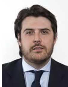
On. Stefano Buffagni Viceministro M5S Eletto in Lombardia

Nato il 6 settembre 1983 a Milano - Laurea in Economia e Gestione Aziendale e in Economia e Management per l'Impresa presso l'Università Cattolica del Sacro Cuore di Milano – Commercialista e revisore di conti . Mediatore Civile ai sensi di quanto richiesto dal D.M. 180/2012 del Ministero della Giustizia. Ha lavorato in uno studio commercialista di Milano di cui è partner: si è occupato di bilanci, valutazioni di aziende, valutazioni di opere pluriennali (appalti) , start-up, business plan, fiscalità nazionale ed internazionale. Nel 2013 è stato eletto Consigliere Regionale in Regione Lombardia entrando a far parte della Commissione consiliare Attività Produttive. Già Sottosegretario agli Affari regionali e le autonomie nel I Governo Conte .