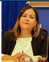
Laura Agea M5S

Nata a Narni (Terni) il 17 febbraio 1978 - Laurea in Sociologia presso Università di Urbino. Nell'aprile del 2014 viene selezionata, attraverso le Primarie online degli iscritti al Movimento 5 Stelle, come uno dei candidati nella circoscrizione Italia centrale per le elezioni europee dove verrà eletta Deputata del Parlamento europeo . E' nominata capo delegazione del Movimento 5 Stelle , all'interno del gruppo politico dell'EFDD (Europe of Freedom and Direct Democracy). Al Parlamento Europeo ha ricoperto il ruolo di coordinatrice per il gruppo EFDD della Commissione Occupazione e Affari Sociali (EMPL) e membro sostituto della Commissione per le Libertà Civili (LIBE) e della Commissione Petizioni (PETI). È stata, altresì, membro della Delegazione per le relazioni con la Palestina e della delegazione all'Assemblea Paritetica ACP (Africa, Caraibi, Pacifico) – UE e sostituta nella delegazione alle commissioni di cooperazione parlamentare UE-Armenia, UE-Azerbaijan e UE-Georgia, nella delegazione per le relazioni con il Canada e nella delegazione all'Assemblea Parlamentare dell'Unione per il Mediterraneo. Si è ripresentata alle elezioni europee 2019, sempre in Italia centrale, non risultando eletta .