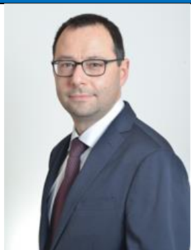
STEFANO PATUANELLI M5S Eletto in Friuli- Venezia Giulia