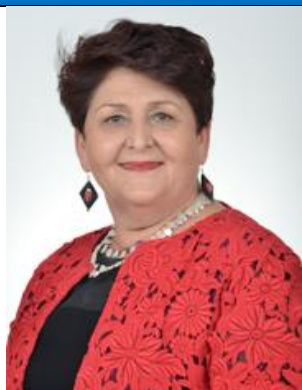
Teresa Bellanova PD Eletta in Emilia- Romagna