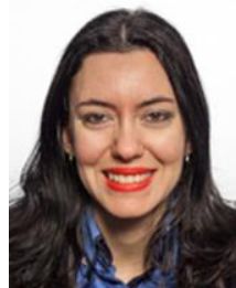
On. Lucia Azzolina M5S Eletta in Piemonte

Nata il 25 agosto 1982 a Siracusa – Laurea in filosofia e Laurea in giurisprudenza - Specializzazione all'insegnamento di storia e filosofia - Insegnante di scuola secondaria superiore.