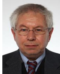
Pierpaolo Baretta PD

Nato a Venezia il 29 giugno 1949 – Diploma di istituto tecnico commerciale - Sindacalista Dal 1971 inizia l'esperienza sindacale come delegato degli impiegati nel Consiglio di Fabbrica. Nel 1973 è diventato responsabile nazionale della formazione del sindacato unitario dei metalmeccanici, fino al 1984 ha rivestito i ruoli di segretario dei metalmeccanici della Fim Cisl, della Provincia di Venezia e della Regione Veneto. Nel 1984 è stato eletto segretario nazionale della Fim. Nel 1997 è stato eletto segretario generale della Fim nazionale. Nel 1998 entra in segreteria nazionale della Cisl e nel 2006 è designato segretario generale aggiunto (insieme a Raffaele Bonanni segretario generale). Eletto per la prima volta alla Camera nel 2008, ha ricoperto l'incarico di Capogruppo del PD nella V Commissione Bilancio . E' stato rieletto alla Camera nella XVII legislatura dove ha ricoperto il ruolo di Sottosegretario al Ministero dell'Economia nel Governo Letta e confermato in questo incarico dal Governo Renzi e successivamente dal Governo Gentiloni .