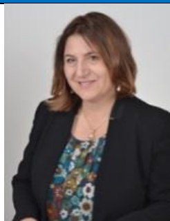
Nunzia Catalfo M5S Eletta in Sicilia