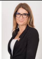
Sen. Simona Flavia Malpezzi PD Eletta in Lombardia

Nata a Cernusco sul Naviglio (Milano) - Laureata in Lettere Moderne - Insegnante di scuola superiore. Nel 2009 aderisce al Partito Democratico e nel 2011 viene eletta nel Consiglio Comunale di Pioltello dove ricopre il ruolo di Capogruppo del Partito Democratico. Alle elezioni politiche del 2013 è stata eletta alla Camera dei deputati, nella circoscrizione Lombardia 1, diventando membro della Commissione Cultura e della Commissione Bicamerale per l'Infanzia e l'adolescenza. Nella XVIII viene rieletta al Senato, dove ha ricoperto il ruolo di membro della Commissione Istruzione e di Vicepresidente del Gruppo PD .