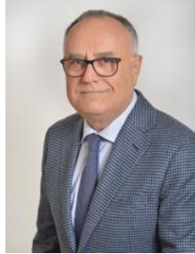
Sen. Stanislao di Piazza