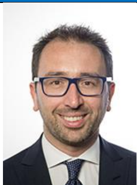
ALFONSO BONAFEDE M5S Eletto in Toscana