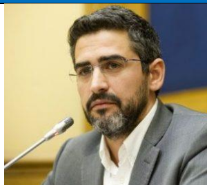
RICCARDO FRACCARO M5S Eletto in Trentino-Alto Adige – SudTirolo