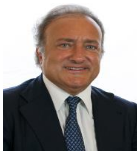
Sen.Salvatore Margiotta PD Eletto in Basilicata

Nato a Potenza il 23 aprile del 1964 – Laurea in ingegneria idraulica presso l'Università di Napoli – Ingegnere. È professore associato di Costruzioni rurali e territorio agroforestale presso l'Università della Basilicata e socio fondatore dello studio di ingegneria Margiotta Associati. E' Presidente dell'ANIAF , Associazione nazionale imprese armamento. È stato membro della direzione nazionale del PD sin dalla nascita del partito nel 2007; da ultimo è stato riconfermato il 7 maggio 2017. Dal 22 luglio 2017 è, su nomina del Segretario Matteo Renzi, responsabile del Dipartimento Infrastrutture del PD. In precedenza è stato segretario provinciale e regionale del Partito Popolare Italiano e poi coordinatore regionale della Margherita e componente della direzione nazionale. E' stato eletto Deputato nelle Legislature XV e XVI. Nel 2008 è diventato Vicepresidente della Commissione Ambiente della Camera . E' stato eletto Senatore nelle Legislature XVII e XVIII dove ha ricoperto il ruolo di Capogruppo PD nella Commissione Lavori Pubblici , nonché di componente della Commissione di Vigilanza RAI.