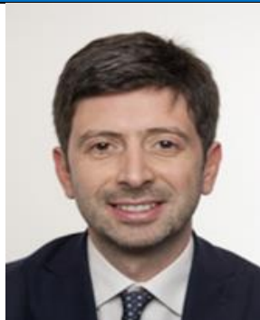
Roberto Speranza LEU Eletto in Toscana