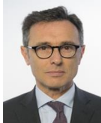
On. Andrea Giorgis PD Eletto in Piemonte

Nato a Torino il 12 aprile 1965- Laurea in Giurisprudenza – Professore universitario di diritto costituzionale presso l'Università di Torino. È autore di numerosi scritti in tema di diritti fondamentali, di forma di governo e di giustizia costituzionale. Fino all'assunzione della carica di deputato è stato uno dei coordinatori del comitato scientifico di Biennale Democrazia . Nel 1991 ha aderito al PDS e quindi ai DS. Dal 1997 al 2011 è stato consigliere comunale della Città di Torino durante l'amministrazione Chiamparino e capogruppo del gruppo consiliare dell'Ulivo e poi del PD. Dal novembre 2009 al febbraio 2014 ha ricoperto la carica di Presidente dell'Assemblea regionale del PD Piemonte . Eletto Deputato nella XVII e nella XVIII legislatura è stato membro della Commissione Affari Costituzionali nonché del Comitato per la legislazione.