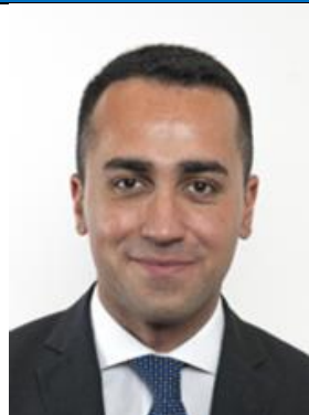
LUIGI DI MAIO M5S Eletto in Campania