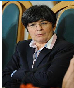
Prof.ssa Maria Cecilia Guerra

Nata a Nonantola (Modena) il 6 dicembre 1957 - Laurea in Economia e Commercio presso l'Università degli Studi di Modena e Master Phil. Degree in Economics all'Università di Cambridge - Professoressa universitaria. Dal 1983 al 1987 ha svolto il dottorato di ricerca in Economia politica istituito dal consorzio delle Università di Bologna, Modena, Padova e Venezia. Dal 1990 al 1995 è stata Professore a contratto all'Università commerciale Luigi Bocconi. Nel 1992 è entrata alla facoltà di Economia dell'Università degli studi di Modena come Professore associato di Scienza delle Finanze e dal 2000 è diventata Professore ordinario della stessa materia . Nel periodo 1989-1999 ha partecipato a gruppi di lavoro e commissioni istituiti presso il Ministero delle Finanze , sui temi della tassazione dei redditi di capitale e delle società. Nel 2006 ha presieduto la commissione sulla tassazione dei redditi di capitale e finanziari diversi, istituita presso il Ministero dell'Economia e delle Finanze. Nel 2007-2008 è stata membro della commissione consultiva e di studio sul trattamento fiscale dei redditi delle famiglie e sulla disciplina in materia di assegni familiari istituita dalla Scuola Superiore dell'Economia e delle Finanze su indicazione del vice ministro dell'Economia e delle Finanze, Visco. Ha svolto attività di consulenza per il Senato della Repubblica (Servizio bilancio) sul tema dei fondi pensione ed ha effettuato audizioni