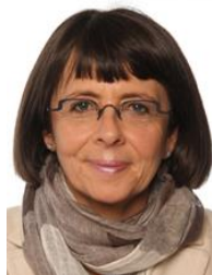
Marina Sereni Viceministro PD

Nata a Foligno (Perugia) l'8 maggio del 1960 – Funzionaria.