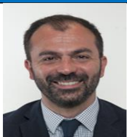
LORENZO FIORAMONTI M5S Eletto nel Lazio