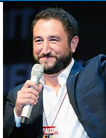
Giancarlo Cancellieri ViceMinistro M5S

Nato a Caltanissetta il 31 maggio 1975 - Diploma di Geometra. Inizia a lavorare nel 1998 in una ditta metalmeccanica come magazziniere. Nel 2007 assieme ad altri cittadini, fonda un comitato a Caltanissetta contro il caro bollette, sposando poi subito la causa del Movimento 5 Stelle partecipando all'organizzazione nel settembre dello stesso anno del 1° V-Day. Da quell'esperienza nascono i Grilli Nisseni, che poi daranno vita al Movimento 5 Stelle Caltanissetta. Dopo diverse manifestazioni organizzate contro la criminalità, nel 2012 fonda Scorta Civica, un comitato che si propone di supportare l'azione dei magistrati antimafia. Attivista e leader degli M5S in Sicilia si è candidato alla presidenza della Regione due volte: nel 2012 e nel 2017, entrambe le volte sconfitto. Da dicembre 2017 è Vicepresidente dell'Assemblea regionale siciliana.