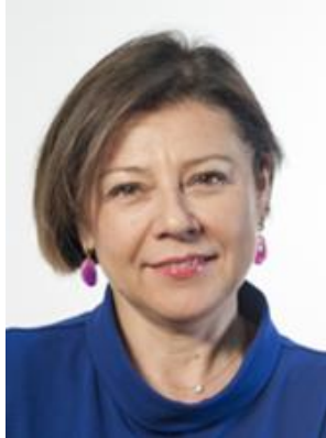
PAOLA DE MICHELI PD Eletto in Emilia- Romagna