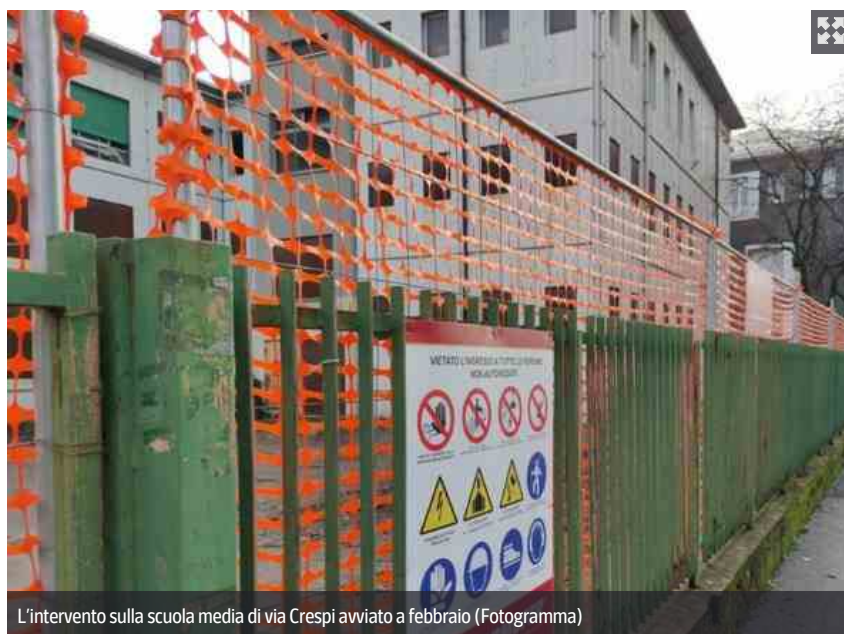
L'intervento sulla scuola media di via Crespi avviato a febbraio