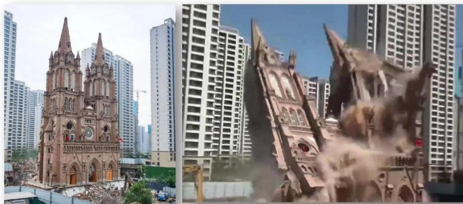
Cina, demolizione di una chiesa